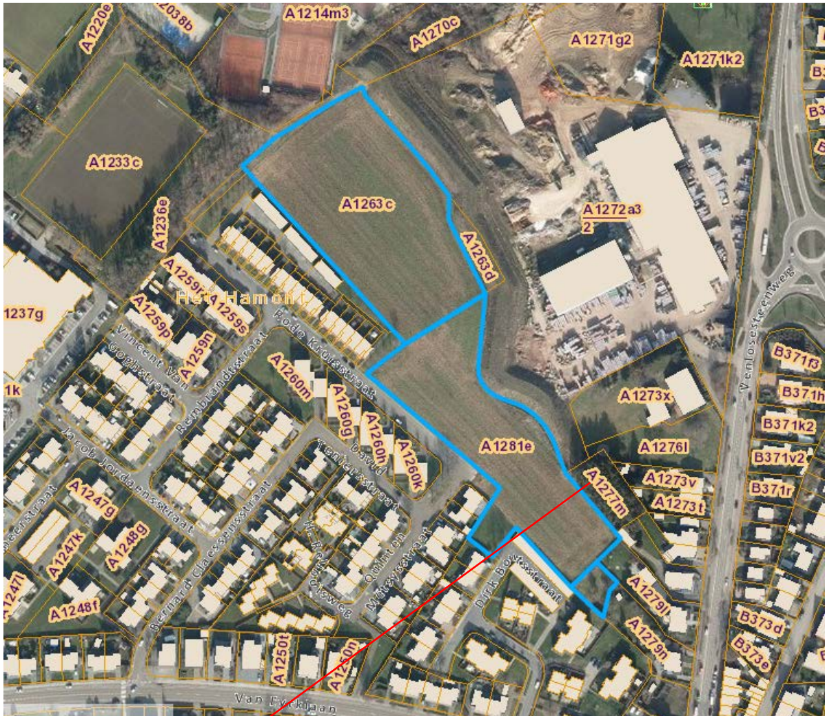
Perceel nr. 1277 M